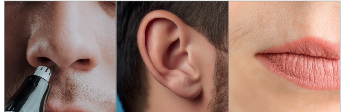
Entfernen von Gesichts- und Körperhaaren