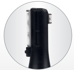
Vertikal gelagerter Doppelscherkopf für Konturen und Augenbrauen