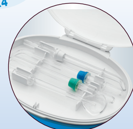
Deckel mit integriertem Aufbewahrungsfach für Aufsätze