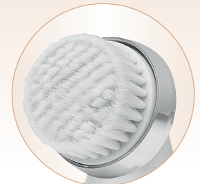
Bürstenkopf / Gesichtsreiniger